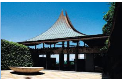
Crématorium Intercommunal de l'agglomération grenobloise, situé à Gières.

Vues du patio en accès extérieur et de la salle de cérémonie. Point de départ du cheminement du Jardin du Souvenir, destiné à la dispersion des cendres et au recueillement des familles.