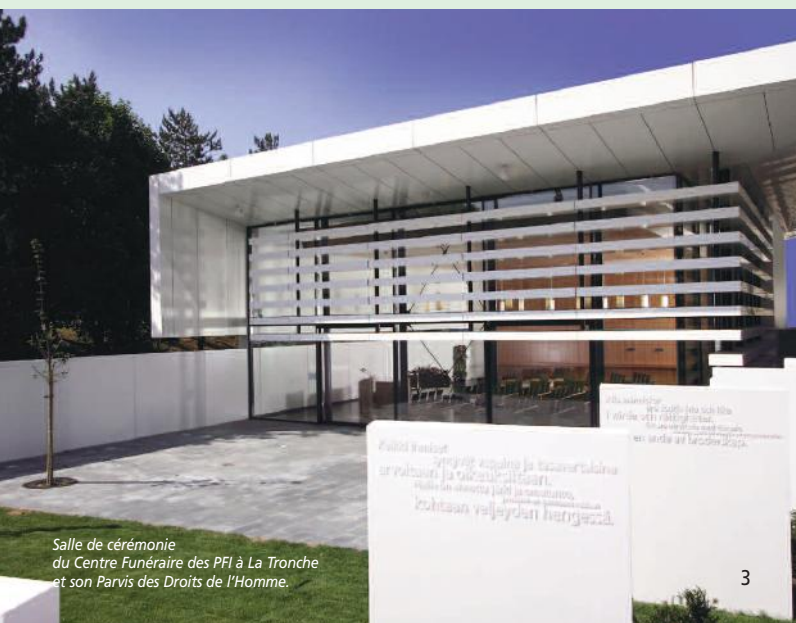
Salle de cérémonie du Centre Funéraire des PFI à La Tronche et son Parvis des Droits de l'Homme.

La relation entre le conseiller funéraire PFI et la famille est une authentique relation de confiance, un réel dialogue personnalisé.