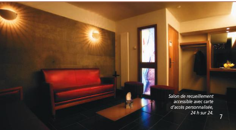
Salon de recueillement accessible avec carte d'accès personnalisée, 24 h sur 24.

Le Centre Funéraire des PFI accueille toutes les confessions et philosophies qui le souhaitent. Ainsi, catholiques, protestants, orthodoxes, israélites, musulmans, bouddhistes, libres-penseurs et athées en ont fait un lieu où se déroulent leurs rites.