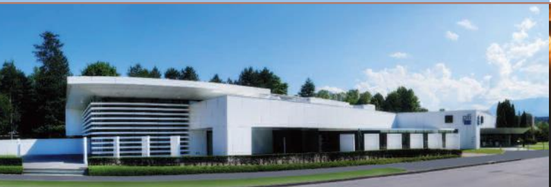
Vue extérieure du centre funéraire des PFI à La Tronche.